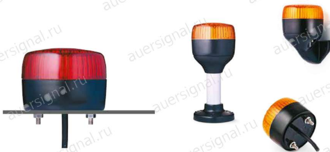
Герметичная изоляция кабеля / входа